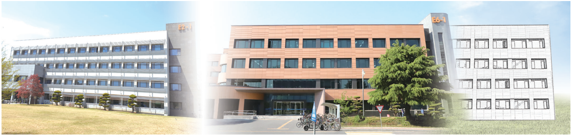
< 산업경영학동 내 수리과학과 >