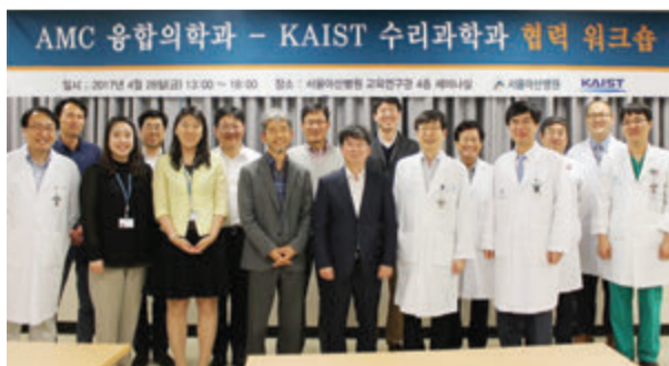
서울아산병원의과의 협력워크숍 (2017. 4. 28). 학, 의료연구에까지 수학자들이, 도대체 못 하는 게 뭔가요?