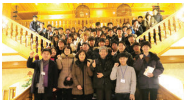
학부 신입생 오리엔테이션 (2017. 2. 24 ~ 25). 우리 학과의 가장 뜻뜻한 2학년 새내기들, 수리과학과로 오신 걸 환영해요!