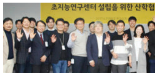
카카오 초지능연구센터(CSI) 참여연구원들의 기념사진

제가 과거에 AI나 딥러닝에 관련된 연구를 수행한 적이 전혀 없어 학생들과 함께 열심히 배우고, 카카오브레인의 연구원들과 교류하면서 다양한 고민을 시작하고 있습니다. 학생이었던 1998년 가을, 확률적 모형이나 최적화와 같은 경영과학(OR, Operations Research)에 대한 지식만 가지고 어느 곳에 잘 사용할 수 있을까 고민하던 시절에 우연히 금융회사에 다니던 지금의 아내를 소개받아 사귀면서 처음으로 금융공학의 많은 문제가 OR과 관련되었음을 깨닫고 금융수학/공학을 박사과정에서 전공하였지만 결국 저의 학문적 관심은 확률론적 방법론의 연구 자체에 있음을 깨달았던 기억이 되살아납니다.