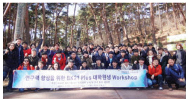
대학원생의 날 행사 (2017. 3. 2 ~ 3 인면도). 이제는 정례화 된 학기 첫 주의 대학원생 날들이 행사, 매학기 흥행을 이어갑니다.